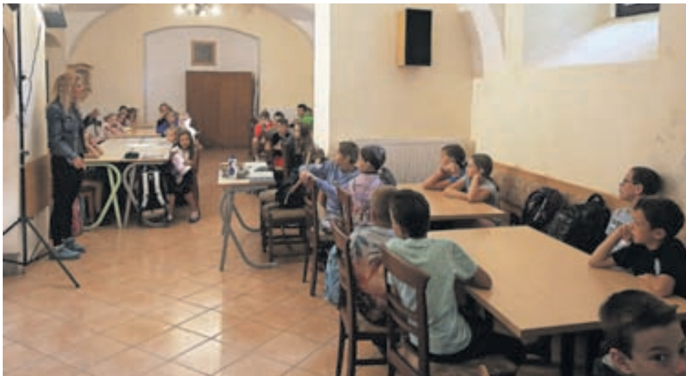
Učenci petih razredov imajo pouk v prostorih župnišča v Adergasu.