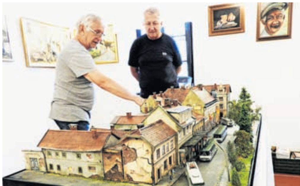
Maketa avtobusne postaje je nastajala eno leto.

šljeni in natančni izdelavi objekta, da se doseže najboljši približek originalu. Maketo stare kranjske avtobusne postaje je začel izdelovati januarja lani in zaključil konec decembra. Postavljena je v čas leta 1970, ko se je avtobusna postaja morala umakniti novim, modernim zgradbam – Globusu in Hotelu Creina. Kranj je s tem izgubil nekaj lepih hiš in kulturno dediščino. Ponosen pa je tudi na maketi Predjamskega gradu in Gradu Bogenšperk. Za božič je od leta 2011 v Petrovčevi hiši postavil Cerkljanske jaslice različnih velikosti. Vsako leto je izdelal in dodal nove znamenite objekte v občini: cerkev Marijinega vne-