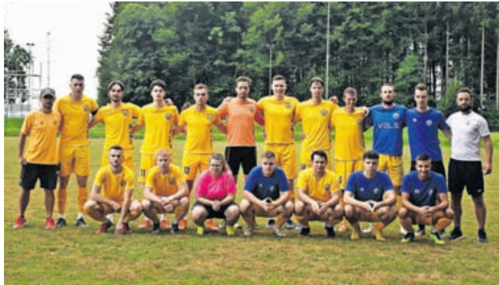
Članska ekipa NK Velesovo Cerklje za sezono 2023/24

Velesovo – Predvsem smo navdušeni nad odzivom otrok, ki se želijo vključiti v naš klub in katerih vpis je ponovno presejal vsa naša pričakovanja. Trenutno v okviru kluba deluje deset otroških in mladinskih selekcij od vrta U6 do kadetske ekipe U17, za katere skrbi ekipa strokovno usposobljenih trenerjev, ki smo jo za novo sezono okrepili še z dvema novima trenerjema. Se pa zaradi vse več novih otrok in posledično dodatnih selekcij soočamo z vse večjo prostorsko stisko in vsi skupaj že nestrpnost pričakujemo prenovo pomožnega igrišča z novo umetno travo. Tukaj gre zagotovo velika zahvala naši občini, ki razume potrebo po dodatnih površinah za treninge in tekme in je v občinski proračun za leto 2023 uvrstila tudi investicije v Nogometnem centru v Velesovem. Kljub temu da je naša članska ekipa v novo sezono vstopila zelo pomlajena, je odlično startala v ligi in trenutno tudi zaseda vrh ligaške lestvice. Dejstvo, da je najmlajša ekipa v ligi MNZ Gorenjske in sestavljena večinoma iz domačih igralcev, nas navdaja s še večjim optimizmom za vse prihajajoče sezone. Člansko ekipo bosta tudi v novi sezoni vodila do-