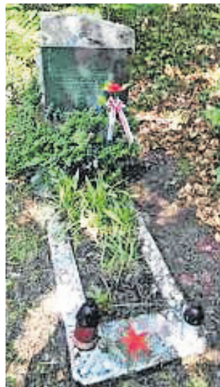
Grob 8. junija 1944 padlega borca

Cerkljanska Dobrava – V ponedeljek, 29. maja, se je v organizaciji Kluba Liborius Cerklje ob grobu borca II. bataljona Gorenjskega odreda odvijal recital pesmi Karla Destovnika Kajuha v okviru stote obletnice njegovega rojstva oziroma