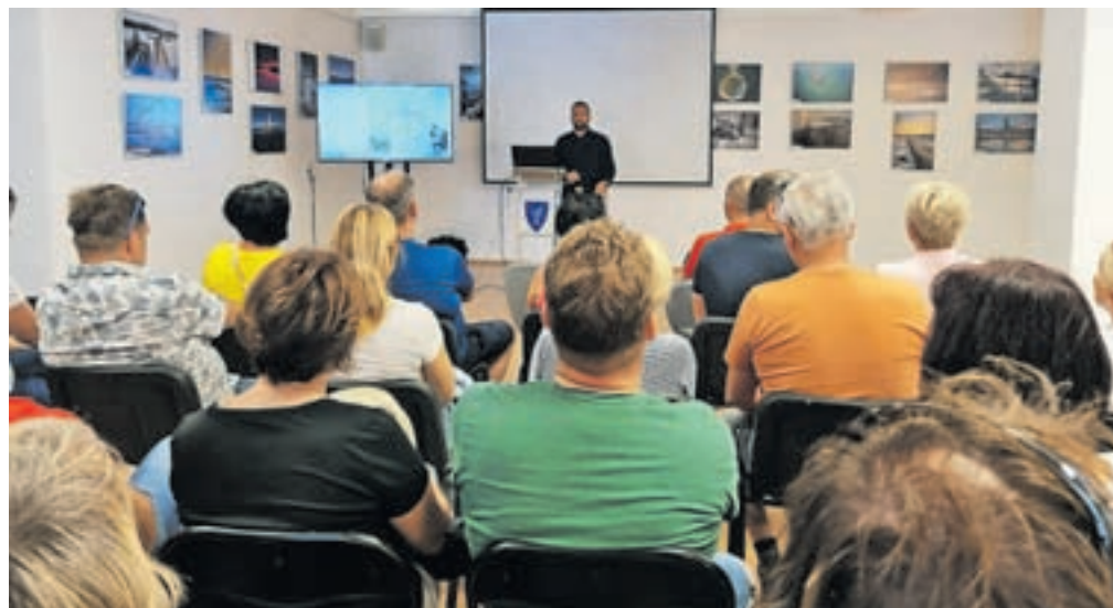
Na obisku v Medulinu

piknika je vsakoletna tombola, kjer glavno vlogo izvedbe uspešno prevzmeta bivša predsednika društva