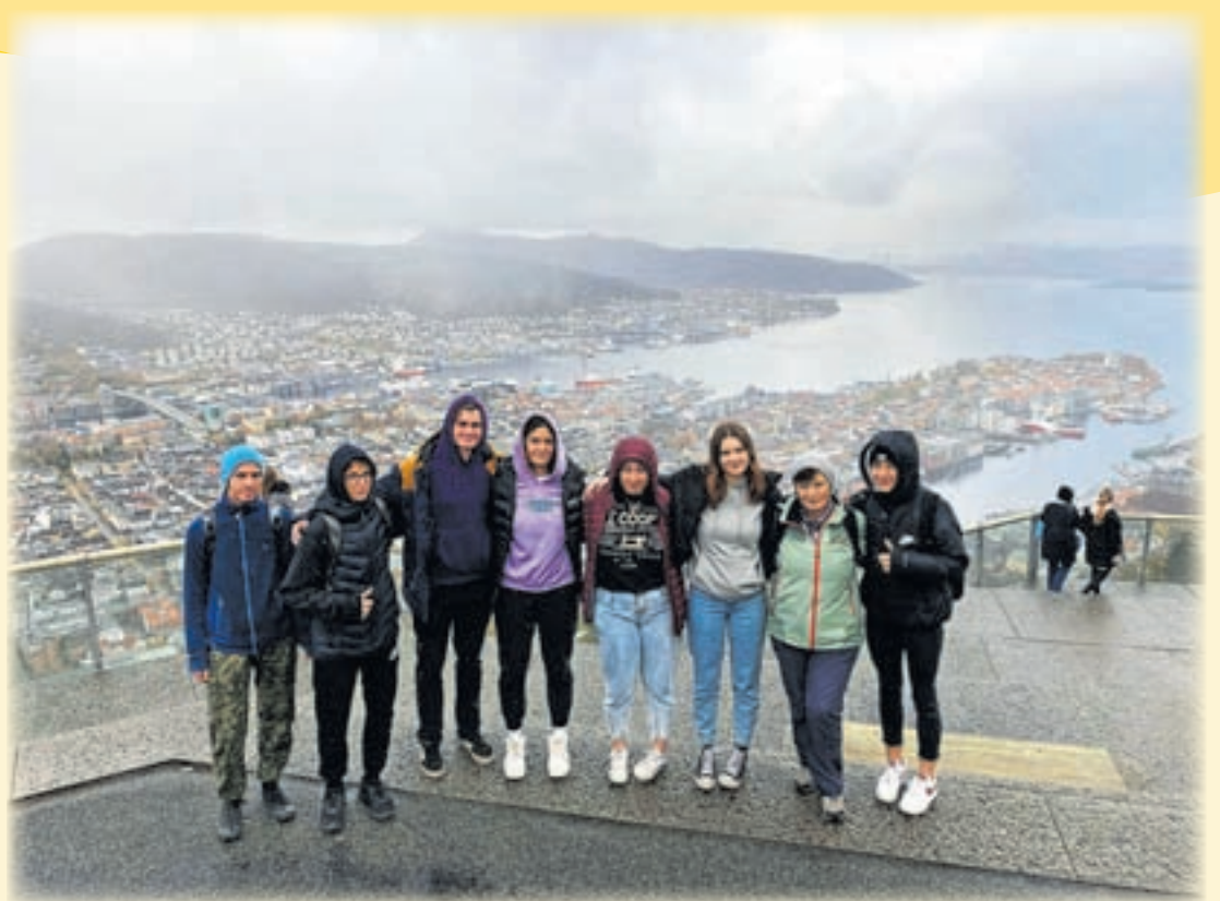
Dijakinje in dijaki z učiteljico na Norveškem

V tem kratkem času so uspeli pridobiti nekaj novih prijateljev , Norvežani so jih zelo lepo sprejeli. Ugotovili so, da stereotipi o hladnih severnjakih ne držijo , saj so bili Norvežani zelo gostoljubni in odprti , slovenske dijakinje in dijake so hitro sprejeli za svoje, jih vključili v skupne aktivnosti.