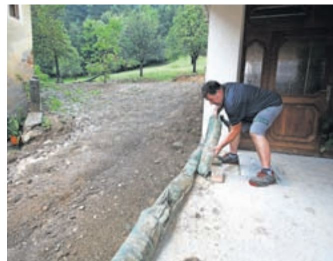
Zaščita vhoda v stanovanjsko hišo ob napovedi nalivov konec avgusta

ske poslopje. Na pomoč jim je priskočilo še okoli 50 prostovoljcev iz vasi Pšata, sosedje, sorodniki, prijatelji in sodelavci. Delali so do noči, da so rešili stanovanjski del in hlev. Čiščenje so nadaljevali še v ponedeljek, torek in sredo, predvsem tistega, kar je bilo nanoseno do hiše.