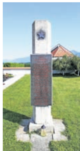
Na spomeniku na Spodnjem Brniku je nekdo v izteku junija prebarval rdečo zvezdo.