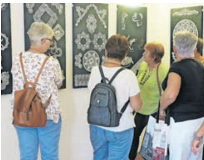
Odprtje razstave je bila tudi priložnost za izmenjavo izkušenj.

kov je bilo okoli tristo. Razstavo so popestrile s prikazom klekljanja, ki je dragocena kulturna dediščina in rokodelska večšina. Priložnost za spremljanje njihovega ustvarjanja in pogovor s klekljaricami bo prihodnji teden tudi v Mestni knjižnici Kranj. Tam se bodo namreč v sredo, 20. septembra, predstavili rokodelci. Dogodek, organiziran v okviru Dnevoev evropske kulturne dediščine, je namenjen ohranjanju redkih in dragocenih znanj, spretnosti in poklicev. Potekal bo od 17. do 19. ure.