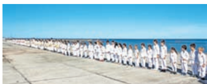
45. Letna karate šola, zbor otrok pred jutranjim treningom