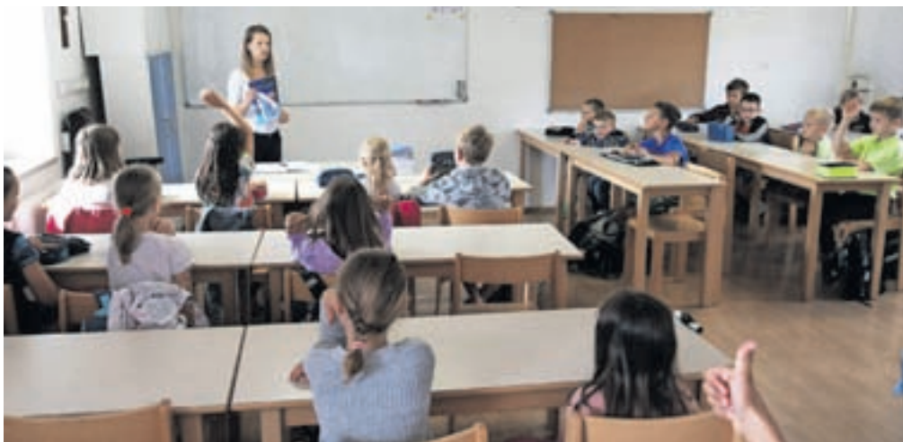
Pouk v učilnici v družinskem in mladinskem centru