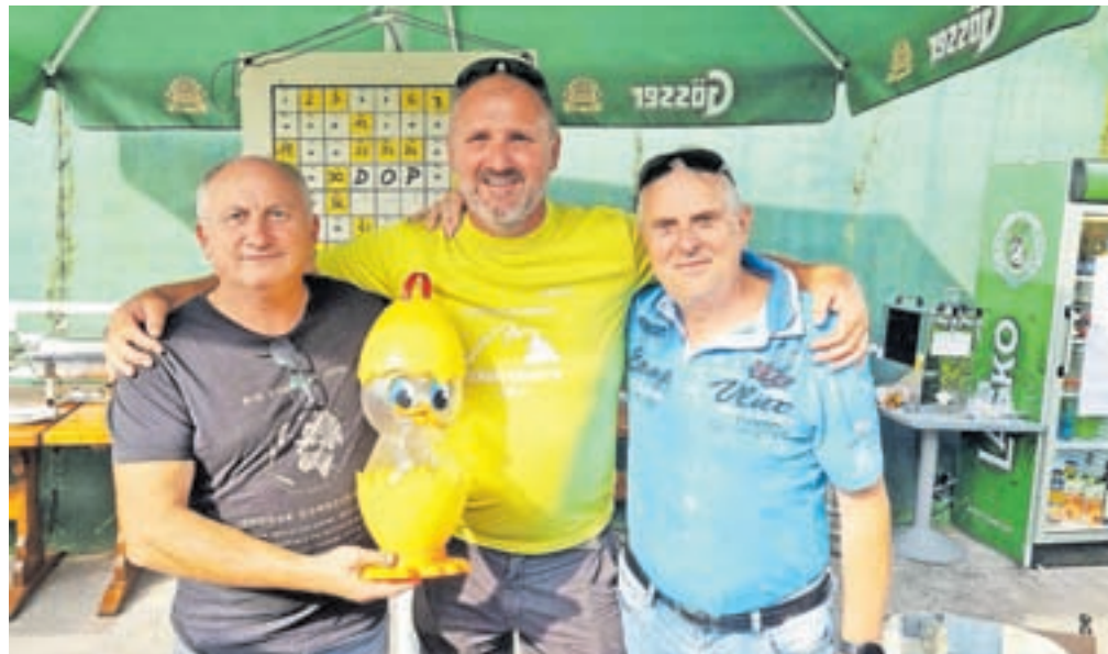
Na društvenem družinskem pikniku

Cerklje – Po uspešno organiziranih prireditvah pozimi in spomladi smo v Društvu obrtnikov in podjetnikov Cerklje poletne mesece namenili za sproščeno medsebojno druženje. Na letošnji dvodnevni izlet smo se odpravili v hrvaško Istro, kjer smo prvi dan najprej obiskali uspešno družinsko podjetje Aura v Buzetu, se v Rovinju vkrkali na ladjico za panoramsko vožnjo s piknikom, lep poletni dan pa zaključili z obiskom Medulina, kjer so nas sprejeli predstavniki našega pobratenega mesta, župan in predstavniki Turističnega združenja. Naslednji dan smo največ časa posvetili obisku narodnega parka na Brionih z bogato zgodovino, ob vrnitvi z otoka pa se srečali z našim članom, ki nam je v Fažani pripravil dobrodošlico, za kar se mu lepo zahvaljujemo. Na poti domov smo obiskali še »najmanjše mesto na svetu – Hum«, v katerem živi le peščica prebivalcev, vendar na svojevrsten način pritegnejo številne obiskovalce. Poletje je prav tako čas za tradicionalni društveni družinski piknik, ki smo ga letos organizirali s pomočjo Pizzerije pod Jenkovo lipo in se ga je udeležilo lepo število članov in njihovih družin. Osrednji dogodek