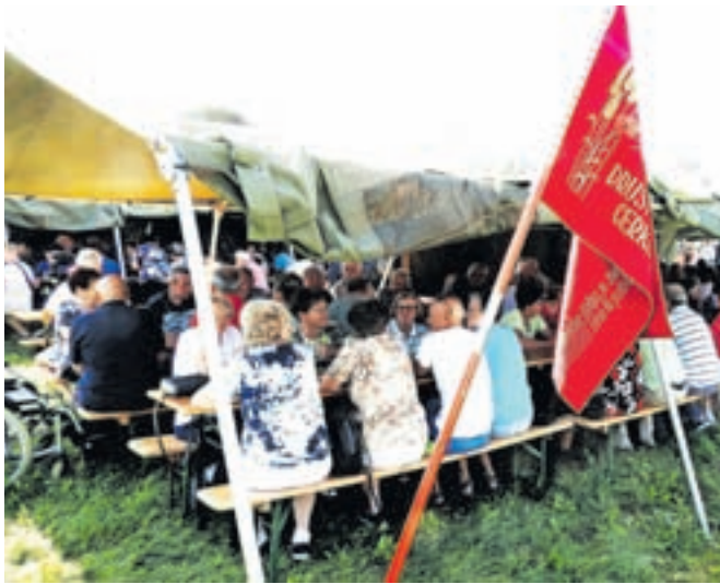
Na pikniku se je zbralo več kot dvesto petdeset članov. Zavetje pred vročino so poiskali pod šotoroma.

Društvo ima 791 članov, ki lahko balinajo, igrajo namizni tenis, kolesarijo, se udeležujejo pohodov, planinarijo, se ukvarjajo z ročnimi deli, delujejo v likovni in kulturni sekciji, telovadijo in plešejo, hodijo na izlete in letovanja.