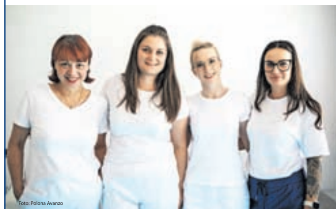
Center za neoperativno dekompresijo hrbtenice Nado center zdravja d.o.o., Zaloška cesta 167, Ljubljana

Poleg dekompresijske terapije pri nas izvajamo tudi splošno fizioterapijo (športne poškodbe, kalcinacije, protibolečinske terapije, terapije po poškodbah ...)