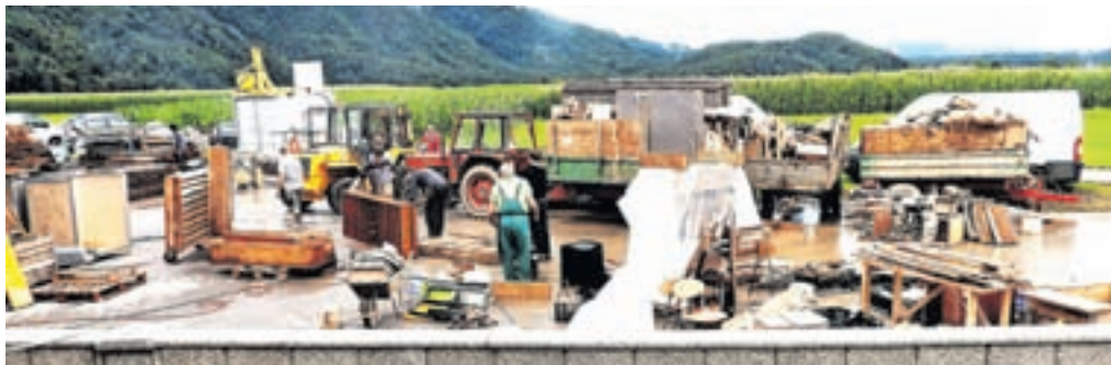
Uničene polizdelke so pripravili za odvoz.

Voda je zalila vse delovne prostore najemnika ter vse proizvodne in skladiščne prostore, deset strojev za mizarstvo proizvodnjo in za orglarstvo Mizarstva Boštic. V kletnih prostorih je segala več kot 130 centimetrov visoko. Akcija reševanja in čiščenja proizvodnih prostorov, odstranjevanja vode, blata in mulja se je začela takoj in je potekala tri dni. Takoj so priskočili na pomoč sosedje in prijatelji iz Cerkelj, pridružili so se jim ljudje iz različnih krajev Slovenije: z Bleda, iz Kresnic, Rafolč, Tuhinja, z