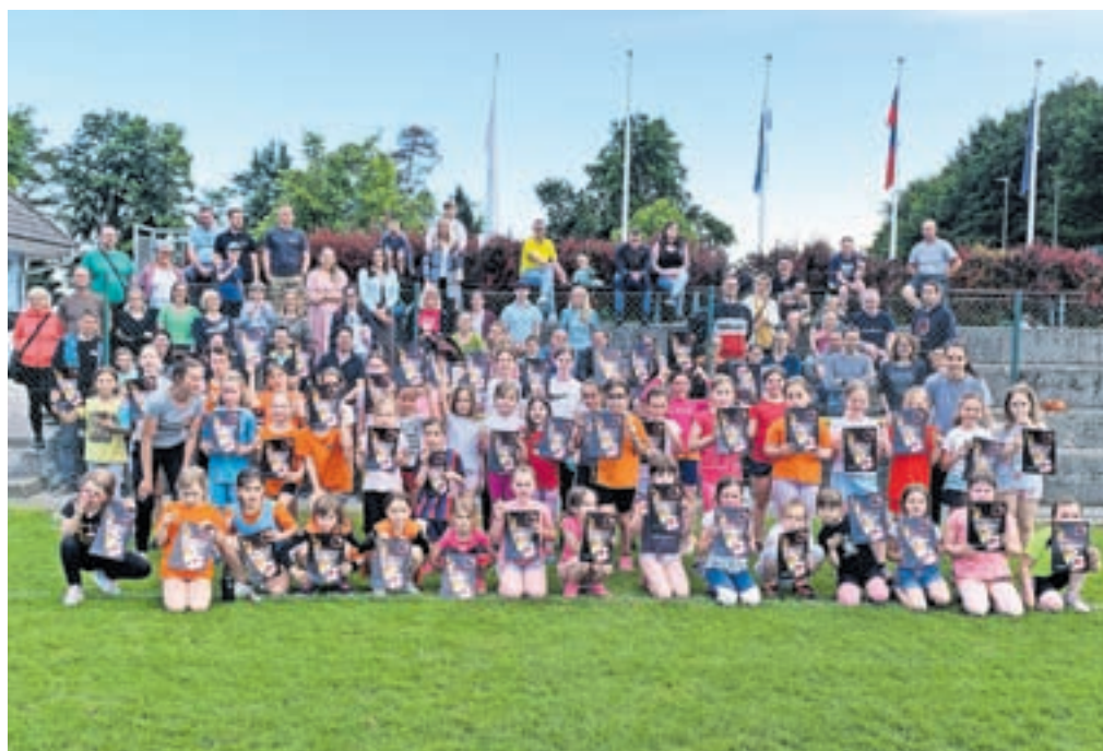
Zaključek minule sezone za krožke / FOTO: ARHIV KLUBA

lahko spremljali in boste tako lahko na tekočem o našem klubu. Vabljeni predvsem tudi v NC Velesovo, kjer v živo lahko podprete naša dekleta. Ob koncu se zahvaljujemo občini za sodelovanje, ki nam ga nudi, da klub nemočno in uspešno delujemo. Še naprej se bomo trudili, da deklice vzgajamo v tekmovalnem in predvsem športnem duhu. Vsem občankam in občanom želimo, da se po poplavih, ki so prizadele občino v minulem mesecu, čim prej vrnejo v življenje, ki so ga imele pred to naravno nesrečo.