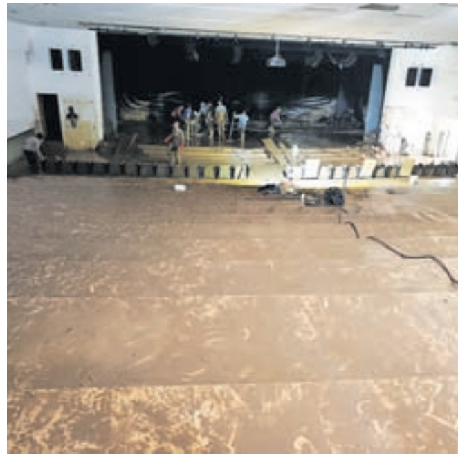
Čiščenje dvorane

Nihče pa takrat niti v najhujših nočnih morah ni pomislil, da se lahko zgodi 4. av-