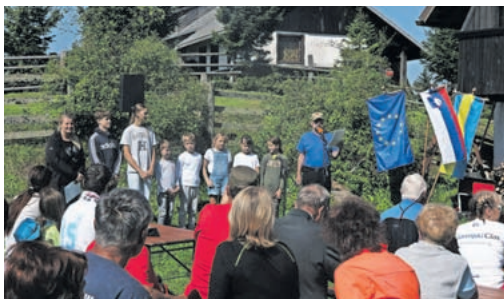
Kulturni program so na Jezercah pripravili učenci Osnovne šole Davorina Jenka.