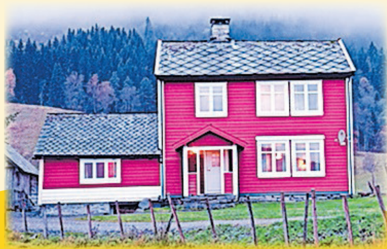
Tipična norveška hiša

V sklopu pouka so se dijakinje in dijaki preizkusili v številnih dejavnostih , kot so ribolov, lov na jelenjad in ptice, pohodništvo ... Ogledali so si tako kulturne kot naravne znamenitosti, raziskovali bližnja mesta ter odkrivali norveško kulturo, njihove navade in običaje.